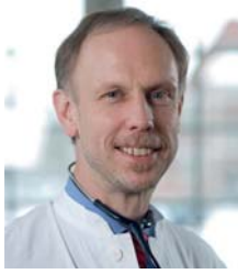
Chefarzt der Fachabteilung Innere Medizin, Rheumatologie, Klinische Immunologie und Osteologie am Immanuel Krankenhaus Berlin

Liebe Kolleginnen und Kollegen, sehr geehrte Damen und Herren,